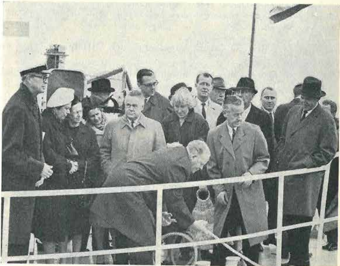
Flera kända profiler från AGA, Sveriges Radio och olika myndigheter ombord på "Gustaf Dalén" för provtur.